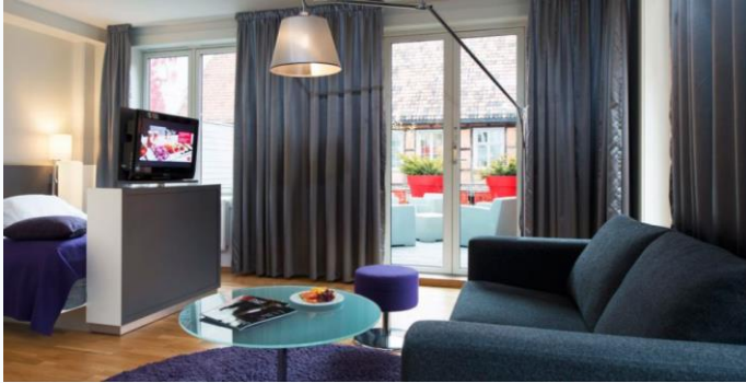
Oslo Thon Hotel Panorama