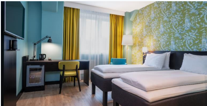
Stavanger Thon Hotel