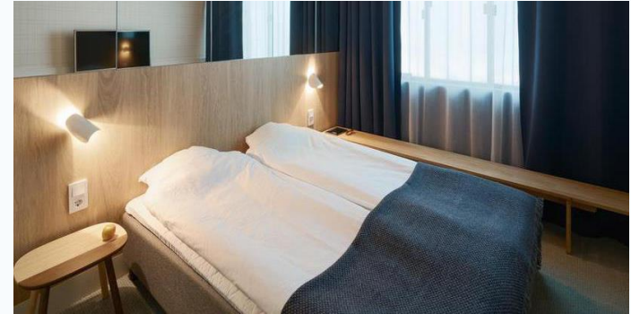
Bergen Zender K